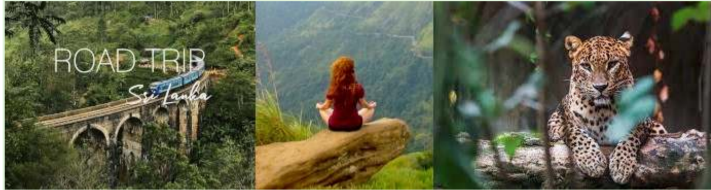
Vacances au Sri Lanka - Visites guidées et expéditions dans la nature

Calendrier : L'expérience a été lancée pendant la pandémie de COVID-19, alors que l'économie du Sri Lanka, dépendante du tourisme, était déjà gravement touchée.