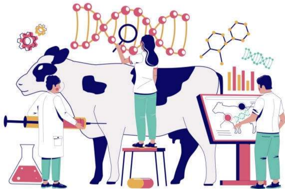
GENETICALLY MODIFIED ANIMALS